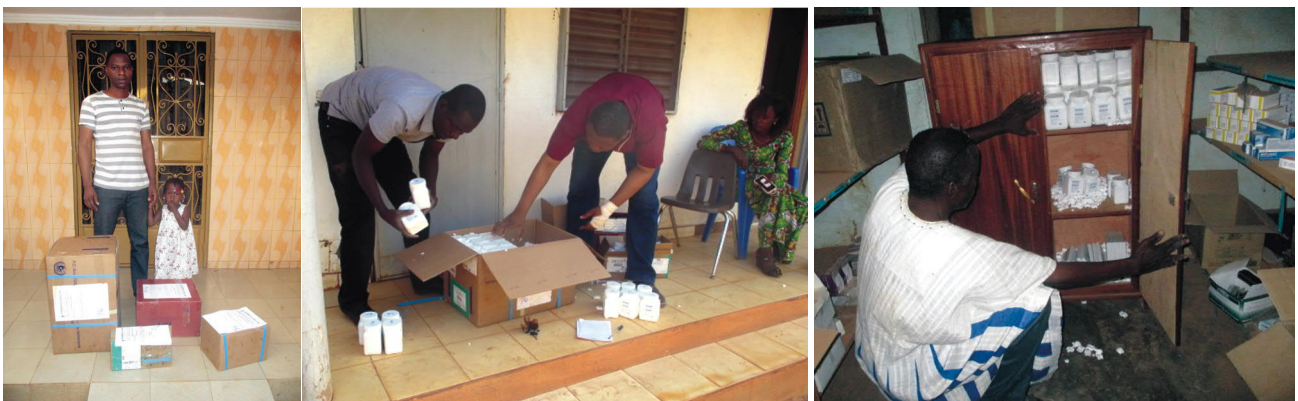
Des Pays-Bas via Ouagadougou à Piéla dans l'armoire verrouillable au Centre Médical